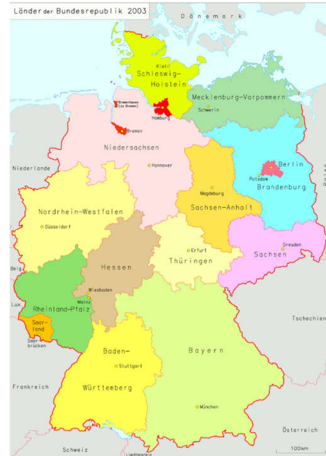
Université de Mayence

Pour la religion juive : le Conseil Central des Juifs en Allemagne entretient depuis 1987 un centre d'archives liées à l'histoire du judaïsme en Allemagne.